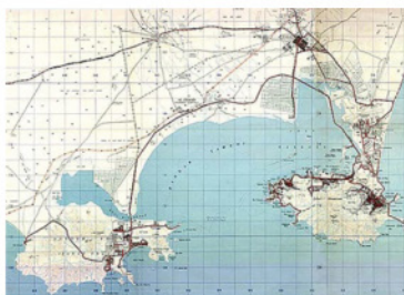
Obr. 2 Mapa Adenu

Koncom prvej tretiny 19. storočia podstatne vzrástol záujem Veľkej Británie o oblasť Južného Jemenu. Britská „Východoindická spoločnosť“ (1) hľadala v tom čase priestor na zriadenie zásobovacej stanice pre lodné spojenie s Indiou. Zo začiatku prichádzal do úvahy sopečný ostrov Perim s plochou 13 km 2 v úžine Červeného mora Bab-el-Mandeb. Nenašiel sa tam však žiaden zdroj pitnej vody, takže o nehostinný ostrov neprejavili vážnejší záujem ani piráti, ktorí už vtedy ohrozovali prepady lode v tejto oblasti. Nakoniec sa najvhodnejším miestom pre základňu ukázal strategicky ležiaci prístav Aden na južnom pobreží Jemenu, ktorý Briti