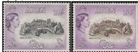
Obr. 13, 14 Aden roku 1972

s rozlohou 70 km 2 v kráteri vyhasnutej sopky na polostrove, ktorý je pripojený k pevnine nízkou šíjou. Používal sa už medzi 5. a 7. storočím pred n. l. Roku 1937 vytvorili Briti z Adenu a okolia samostatnú korunnú kolóniu (CSG 64 Znak kolónie) s rozlohou 121 km 2 . Spojené kráľovstvo uznalo nezávislosť kráľovstva Severný Jemen, ktoré sa zrieklo snáh o pripojenie oblasti Južného Jemenu a kolónie Aden.