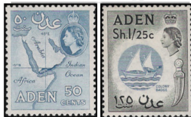
Obr. 11 Aden v zape, Obr. 12 Znak kolónie

s rozlohou 70 km 2 v kráteri vyhasnutej sopky na polostrove, ktorý je pripojený k pevnine nízkou šíjou. Používal sa už medzi 5. a 7. storočím pred n. l. Roku 1937 vytvorili Briti z Adenu a okolia samostatnú korunnú kolóniu (CSG 64 Znak kolónie) s rozlohou 121 km 2 . Spojené kráľovstvo uznalo nezávislosť kráľovstva Severný Jemen, ktoré sa zrieklo snáh o pripojenie oblasti Južného Jemenu a kolónie Aden.