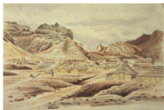
Obr. 3 Aden 1849

Koncom prvej tretiny 19. storočia podstatne vzrástol záujem Veľkej Británie o oblasť Južného Jemenu. Britská „Východoindická spoločnosť“ (1) hľadala v tom čase priestor na zriadenie zásobovacej stanice pre lodné spojenie s Indiou. Zo začiatku prichádzal do úvahy sopečný ostrov Perim s plochou 13 km 2 v úžine Červeného mora Bab-el-Mandeb. Nenašiel sa tam však žiaden zdroj pitnej vody, takže o nehostinný ostrov neprejavili vážnejší záujem ani piráti, ktorí už vtedy ohrozovali prepady lode v tejto oblasti. Nakoniec sa najvhodnejším miestom pre základňu ukázal strategicky ležiaci prístav Aden na južnom pobreží Jemenu, ktorý Briti