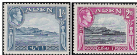
Obr. 9, 10 Adenský prístav

Otvorenie Suezského prelivu roku 1869 podpořilo námornú dopravu v Červenom mori. Veľká cesta medzi Európou a Indiou sa obrátila takmer na polovicu. Vznikol tým aj význam Adenu. Roku 1892 získala prístav Aden „Východoindická spoločnosť“ a vznikla z neho najväčší prístav oblasti. Briti ustanovili s Omanmi (2) hranicu medzi Severným a Južným Jemenom. S miestnymi vládcami uzavreli dohodu, ktorá zabezpečila zachovanie dvojtlačového politického usporiadania teritória a súčasne deklarovala prebývať časť kolónie Aden na Adenský prístav (3) , rozdelený na viaceré sultanátov a emirátov. Roku 1901 navštívil Aden kráľ Ľad V. Oman a v oblasti Jemenu definitívne odlišil od roku 1908. Hospodársky rozvoj teritória Južného Jemenu sa zintenzívnil predovšetkým v Adene, čomu výrazne napomohlo roku 1930 objavenie ropy na Arabskom polostrove.