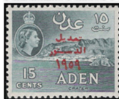
Obr. 16 Revízia ústavy 1959

Bab-el-Mandeb, v predĺžení „Jemenu dl“, je úžina Červeného mora medzi Jemenom na Arabskom polostrove a Džibutiom na africkom pobreží. Je strategickým miestom na trase, ktorá spája Stredozemné more cez Suezský preliv, Červené more a Adenský záliv s Arabským morom a Indickým oceánom. Osladiť sa, že denne prejde 3,3 milióna ton ropy (230 tisíc m 3 ), čo sú 4 percentá celosvetovej ťahy. Jej vzdialenosť od Džibutijskeho mysu na Celebskom polostrove v Južnej Indii je najväčšie rozmer pevniny Ázie 30 865 km. Červené more je vnútrozemné more Indického oceánu medzi Arabským polostrovom a Afrikou s rozlohou asi 450 000 km 2 , dĺžkou 2 000 km, šírkou 350 km a maximálnou hĺbkou 3 039 m.