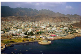
Obr. 4 Aden 1969