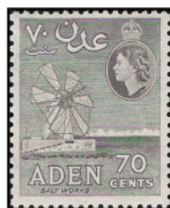
Obr. 15 Výroba soli

Bab-el-Mandeb, v predĺžení „Jemenu dl“, je úžina Červeného mora medzi Jemenom na Arabskom polostrove a Džibutiom na africkom pobreží. Je strategickým miestom na trase, ktorá spája Stredozemné more cez Suezský preliv, Červené more a Adenský záliv s Arabským morom a Indickým oceánom. Osladiť sa, že denne prejde 3,3 milióna ton ropy (230 tisíc m 3 ), čo sú 4 percentá celosvetovej ťahy. Jej vzdialenosť od Džibutijskeho mysu na Celebskom polostrove v Južnej Indii je najväčšie rozmer pevniny Ázie 30 865 km. Červené more je vnútrozemné more Indického oceánu medzi Arabským polostrovom a Afrikou s rozlohou asi 450 000 km 2 , dĺžkou 2 000 km, šírkou 350 km a maximálnou hĺbkou 3 039 m.