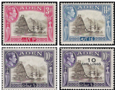
Obr. 5 – 8 Osladenie Adenu